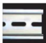
DIN Schienen- Geräte H 35mm